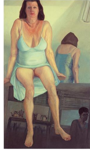
"נערות לוח שנה" שמן על בד 390X190 ס"מ 1999-2001