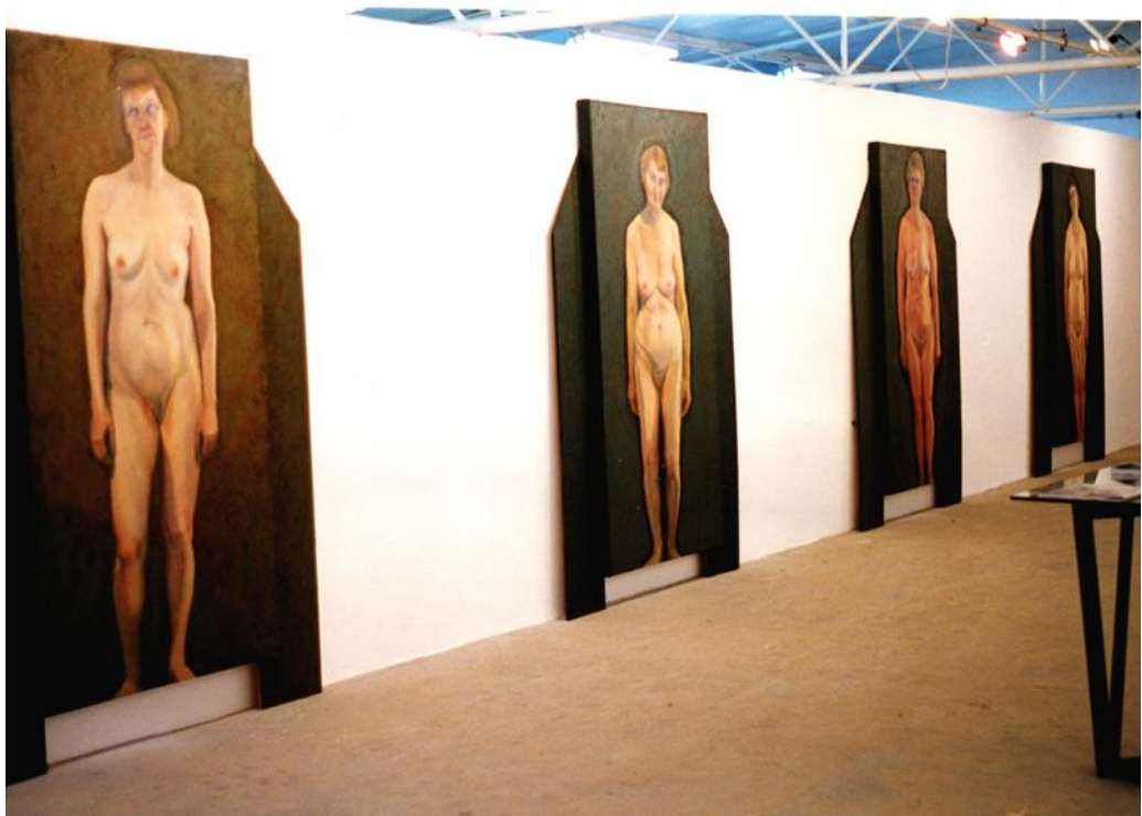
"עדות" מראה תערוכה גלריה ארסופ 1994.