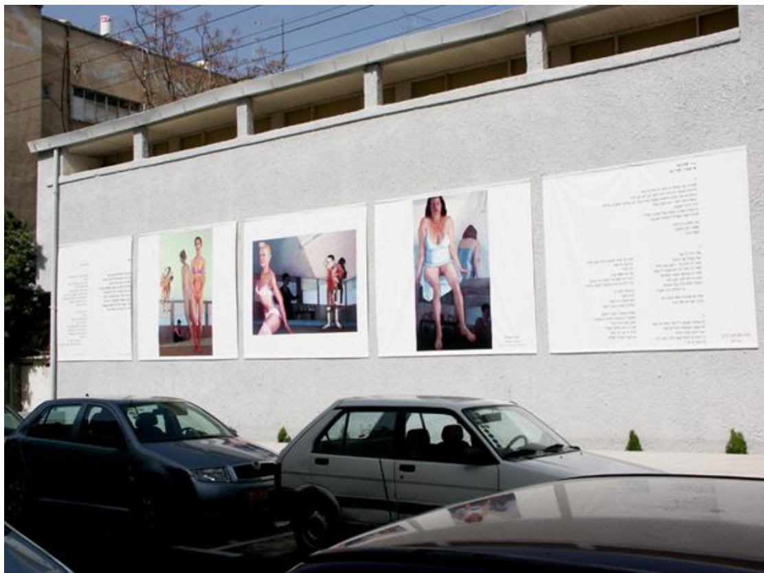
בשנים האחרונות אני מציירת נערות ונשים אתיופיות. המבט שלי בנשים האתיופיות הוא מבט מוקסם. את חיה ובנותיה ציירתי מוך התבוננות.